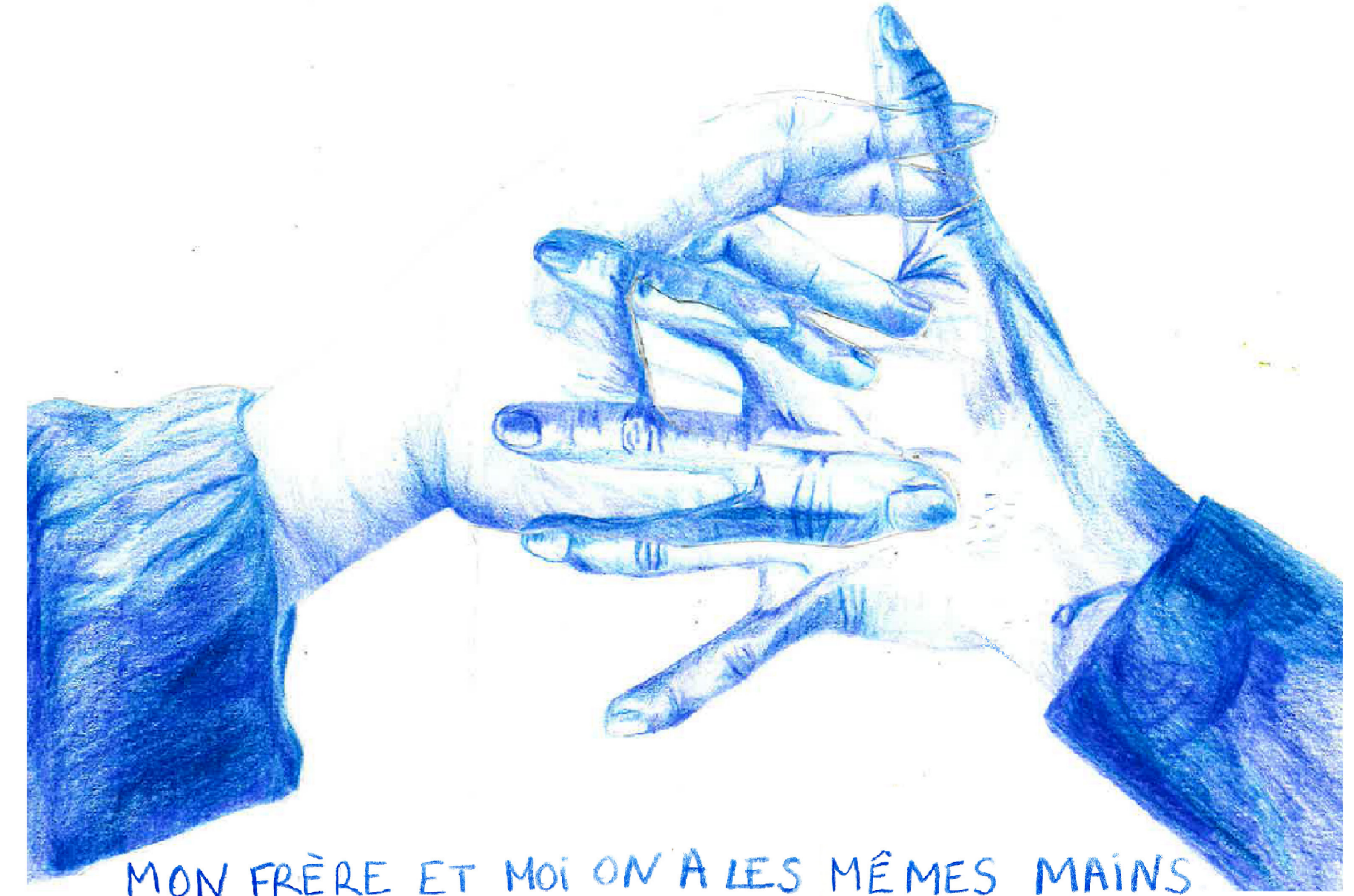
MON FRÈRE ET MOI ON A LES MÊMES MAINS ON EST LES MÊMES HUMAINS

Je dessine aux crayons de couleurs, feutres, pastels à l'huile et dans les notes de mon téléphone. Une famille, une tribu, une bande, c'est du soutien. Ma tribu c'est les humains.