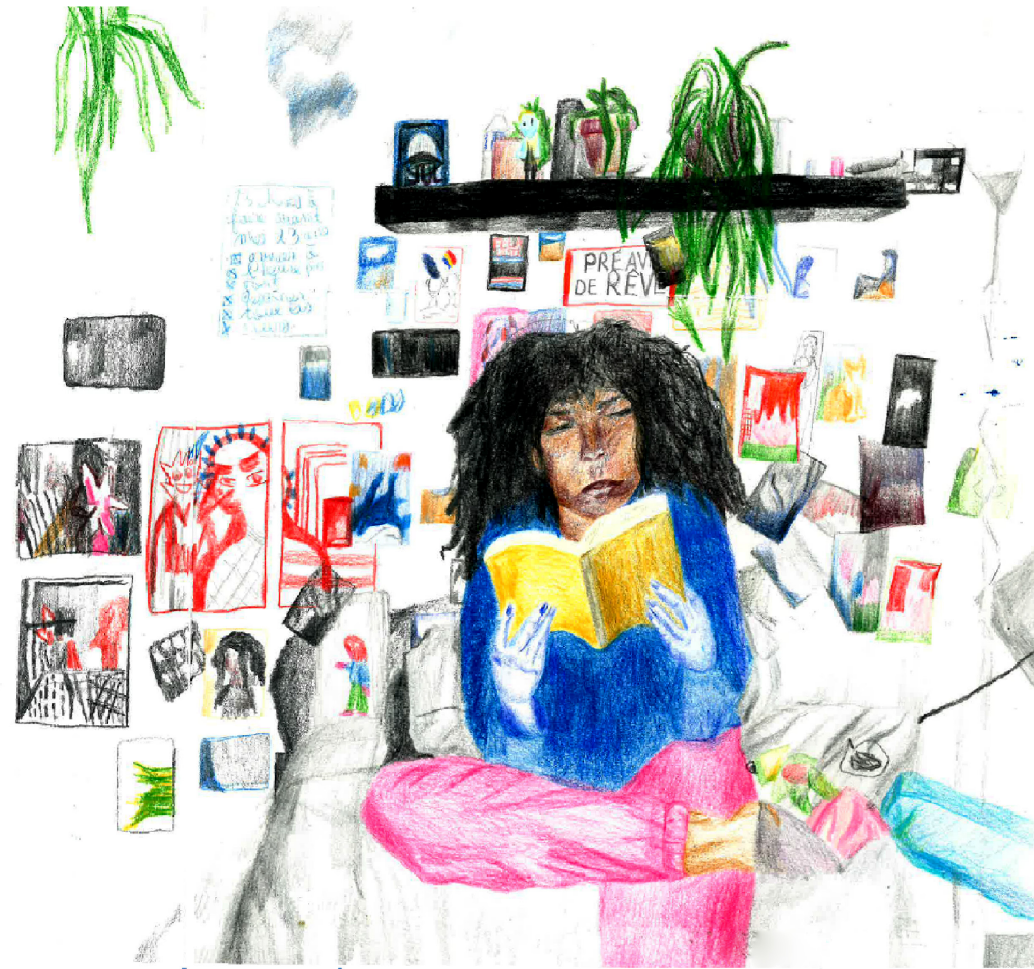
JE SUIS DE NATURE SOLITAIRE